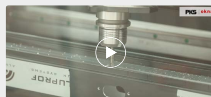
Výroba hliníkového okna