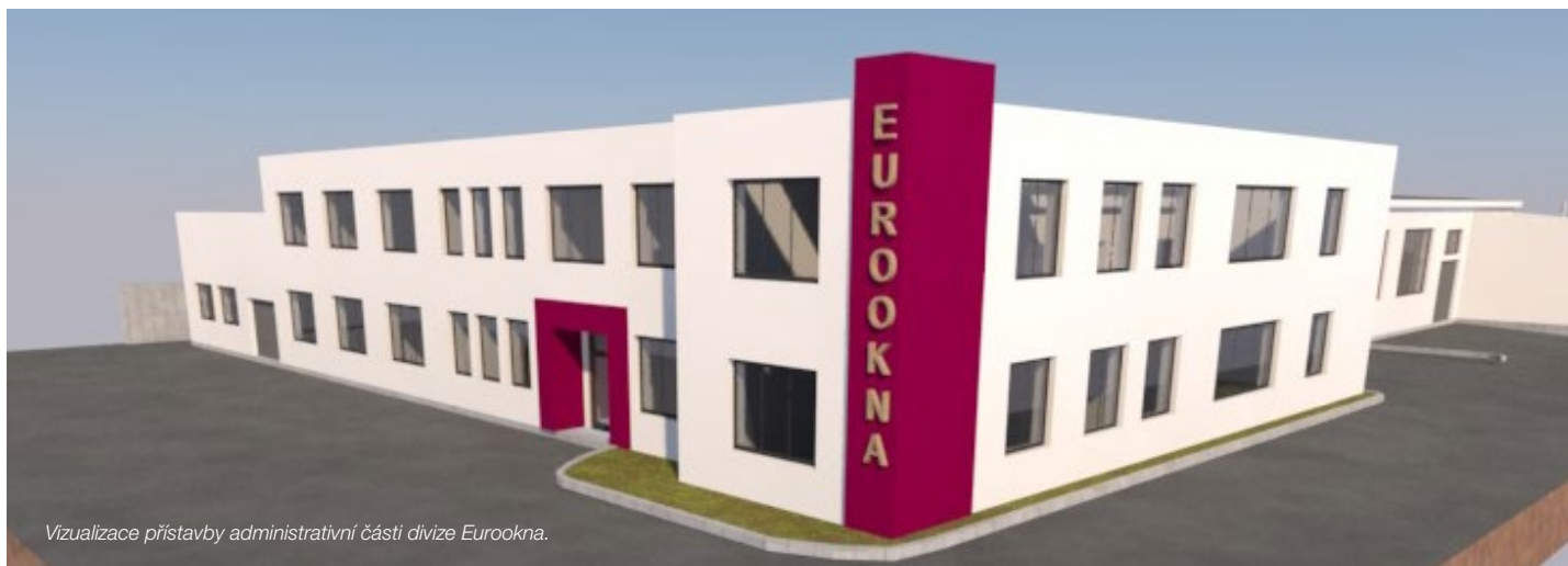
Vizualizace přístavby administrativní části divize Eurookna.

Novinky z divize Eurookna jsou tentokrát v teoretické rovině. Nicméně v rámci neustálého vývoje je potřeba pracovat i na záležitostech s delším časovým horizontem vyžadujících nejen čas, ale i rozvahu a nemalé množství peněz. A právě přesně taková je tato novinka: celý tým, který se podílel na přípravě záměru rozšíření výrobních prostor a sociálního zázemí, již dokončil svoji činnost. A výsledky své práce předkládá představenstvu společnosti PKS okna k posouzení.