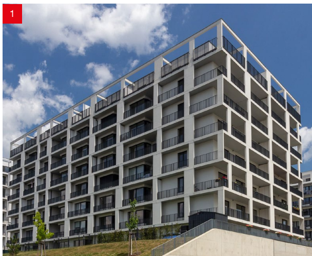
Foto: 1) Bytový komplex – VIVUS Kolbenova, 2) Bytový komplex – Bohdalecké kvarteto, 3) Rezidence – Garden lofts, 4) Rezidence – Hagibor, 5) Bytový komplex – U Šárky, 6) Bytový komplex - Kaskády Barrandov

Náš dlouholetý firemní slogan „Okna prověřená Vysočinou“ odkazuje na lokalitu kraje Vysočina, kde máme sídlo firmy a největší výrobní kapacity. Už mnoho let je pravdou, že zajímavé a velké bytové projekty s našimi okny najdete i v našem hlavní městě – v Praze. Namátkou vybíráme některé bytové projekty z poslední doby.