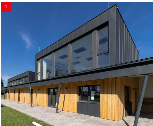
Foto: 1) Fotbalové kabiny - Sobiřov, 2) Rodinný dům - Izrael, 3) Bytový komplex - Praha Karlín, 4) Bytové domy - Beroun, 5) Bytové domy - Praha Čimice, 6) Bytový komplex - Praha Žižkov

V poslední době jsme realizovali mnoho zajímavých zakázek ať už s plastovými, dřevěnými, dřevohliníkovými nebo i hliníkovými okny. Některé zakázky jsme po jejich kompletním dokončení nafotili a nyní Vám můžeme některé z nich ukázat.